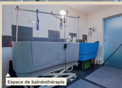
Espace de balnéothérapie

Ce soin est préconisé pour le confort de votre compagnon ou dans le cadre d'un soin postopératoire par exemple; le bain à une température adaptée, suivi d'un massage approprié offrent détente et soulagement à l'animal.