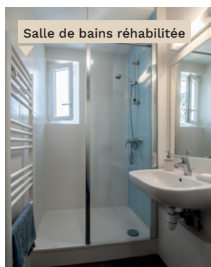
Salle de bains réhabilitée

En outre, l'ensemble des portes palières et des chaudières a été remplacé .