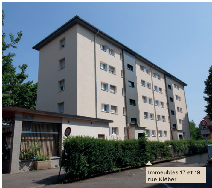
Immeubles 17 et 19 rue Kléber