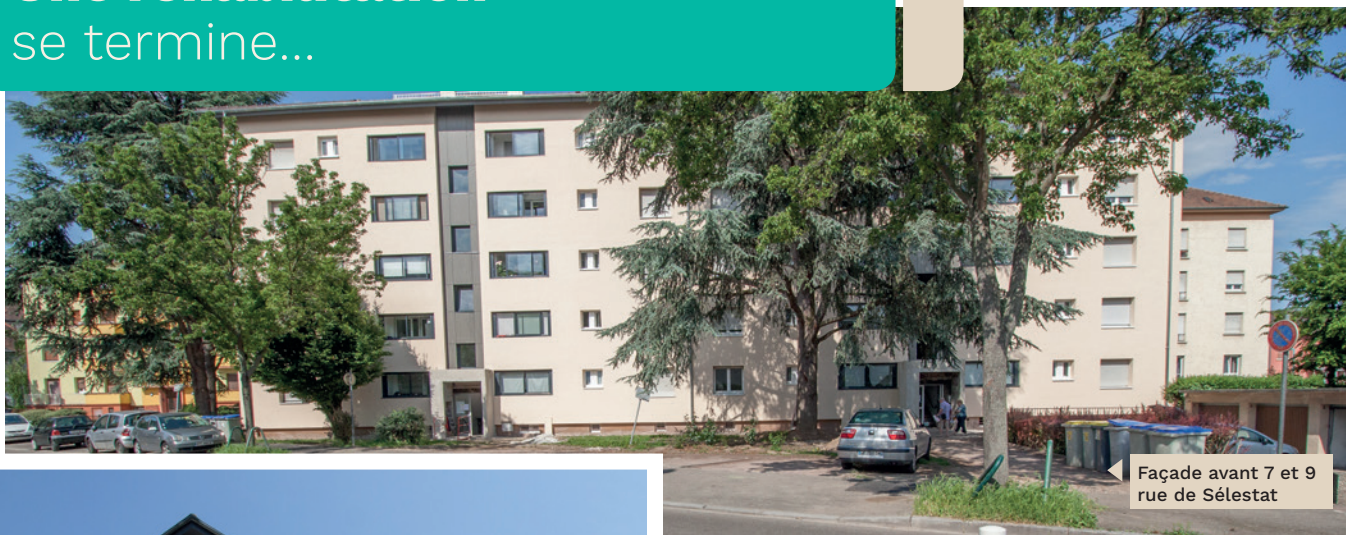
Façade avant 7 et 9 rue de Sélestat