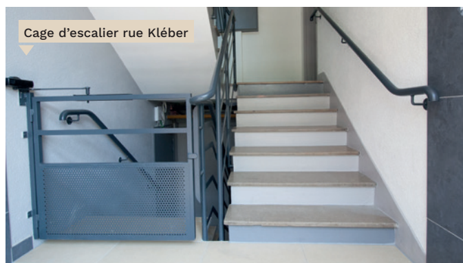
Cage d'escalier rue Kléber