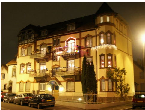
La dernière réalisation du Foyer Moderne : 10, rue de Cronembourg.

Pour chacun d'entre vous, penser qu'une société est faite de personnes différentes, qui peuvent se compléter sans s'affronter, et vivre en bonne intelligence, pourvu que chacun fasse un petit effort de patience, de compréhension et d'ouverture à ses voisins. Et si on essayait ?