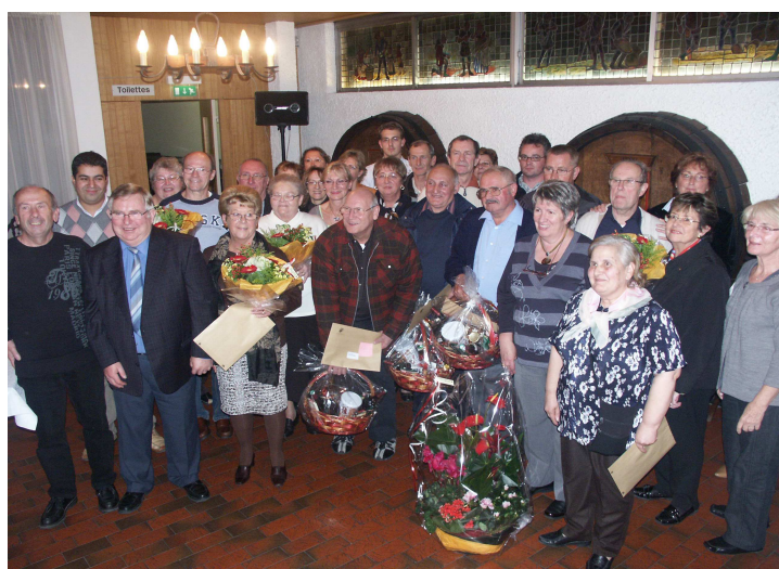
Le Foyer Moderne et la ville de Schiltigheim félicitent les grands vainqueurs de cette année 2008 mais tiennent avant tout à remercier toutes celles et ceux qui ont investi leur temps et leur énergie dans l'embellissement de notre commune.