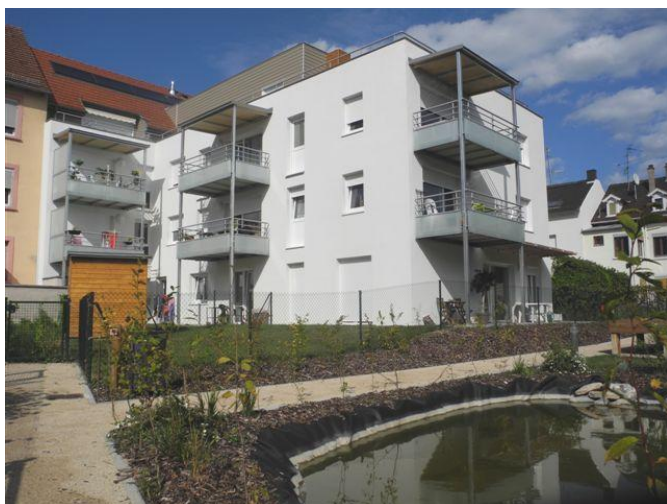
NAOS ARCHITECTURE Schiltigheim

Les locataires, pour certains déjà logés au Foyer Moderne et ayant pu bénéficier d'une mutation interne, ont emménagé tout au long de l'été dans les 66 logements B.B.C. (Bâtiment Basse Consommation) .