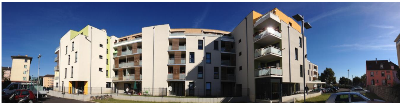
THALES ARCHITECTURES Schiltigheim