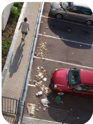
La résidence Verdi n'est pas épargnée...

En outre, la Communauté Urbaine de Strasbourg nous a signalé que la mise à disposition de bennes pourra être suspendue voire abandonnée du fait de l'usage abusif qui en est fait.