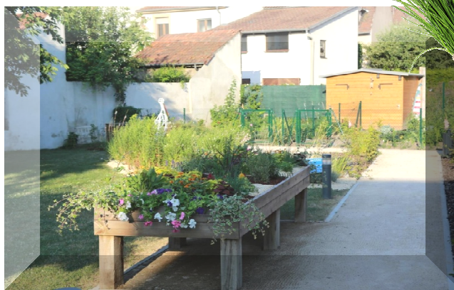
L'hercier : ciboulette, thym, persil, romarin...