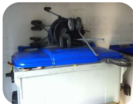
La place d'une poussette usagée n'est en aucun cas dans le local poubelles mais en déchetterie !