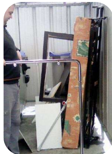
Il est navrant de trouver autant d'encombrants dans les parties communes