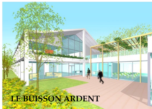
LE BUISSON ARDENT

M. SILBEREISS : Je les invite à venir nous rencontrer car le restaurant ainsi que les activités organisées au sein de l'établissement sont accessibles à toutes les personnes âgées du quartier !