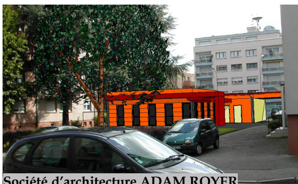
Société d'architecture ADAM ROYER