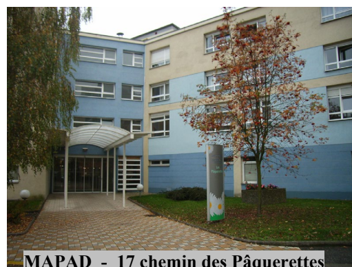
MAPAD - 17 chemin des Pâquerettes

M. SILBEREISS : La Maison d'Accueil a ouvert ses portes en 1992, en tant que locataire du Foyer Moderne, et a une capacité de 84 lits pour des personnes seules ou en couple. Les chambres sont équipées d'une salle d'eau, et chaque locataire a la possibilité de personnaliser et de recréer son intérieur. Une équipe de professionnels est au service des personnes jour et nuit pour leur dispenser soins, confort et animations.