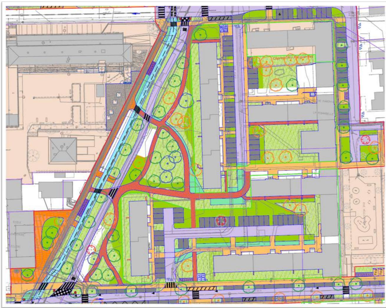
Plan de masse global du projet ESPEX